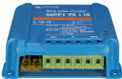
Zonne-laadcontroller MPPT 75/15